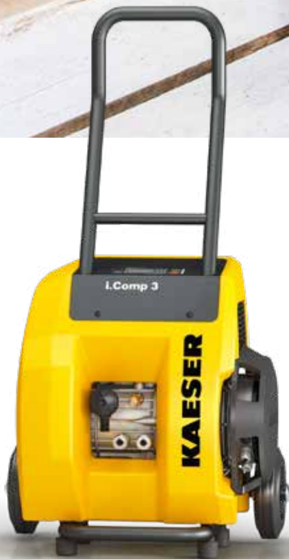
Afb.: i.Comp 3

Uitstekend geschikt om lange afstanden te overbruggen