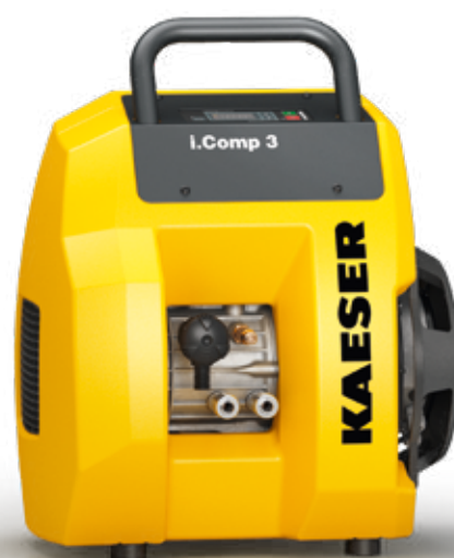
Afb.: i.Comp 3